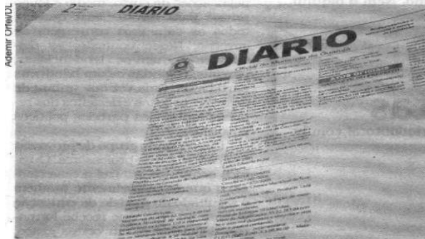
O Diário Oficial de ontem saiu com três páginas em branco, contendo somente os atos oficiais do Executivo e do Legislativo

Conforme o termo de aditamento de contrato, os serviços de impressão e distribuição do Diário Oficial do Município de Guarujá foram contratados por um período de 12 meses ao custo de R$ 500.050,00.