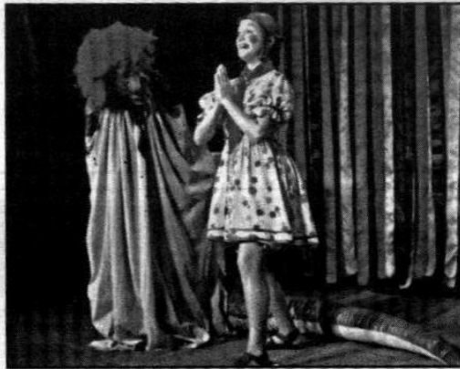
'Boi Viramundo' é dica na programação do fim de semana